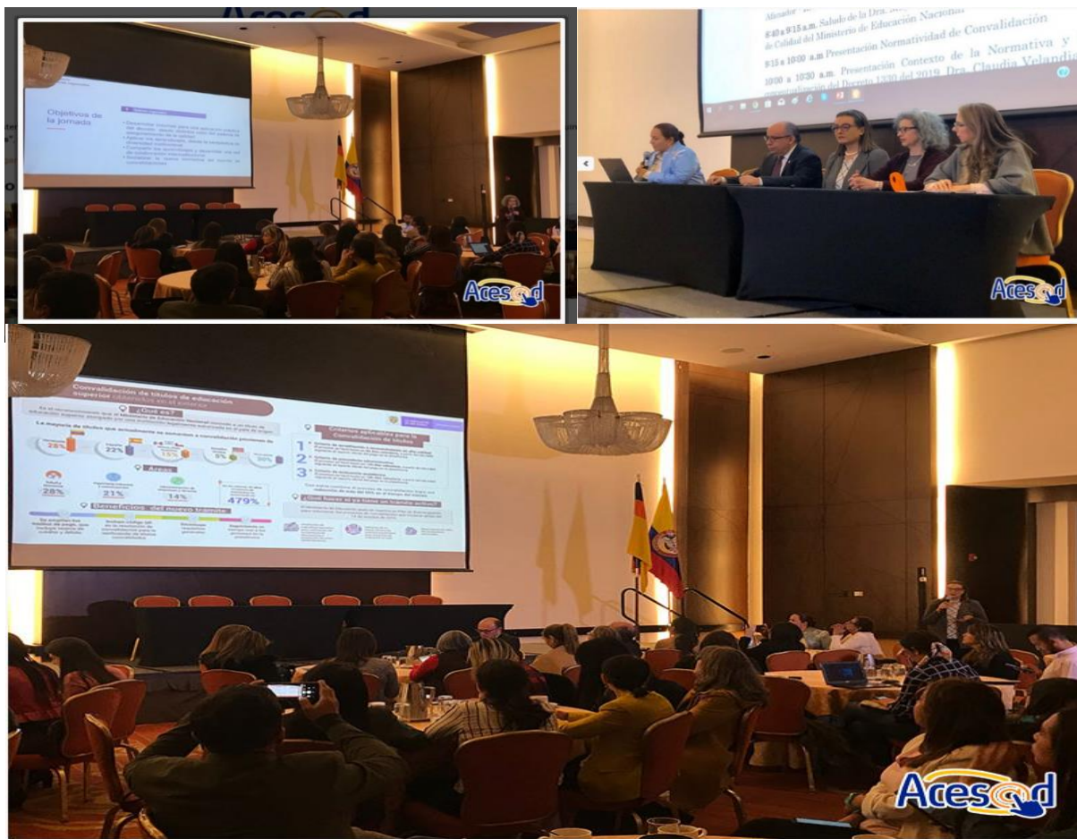
d) Serie de Webinar Académicos 2019 – 2020 (AIESAD – ACESAD).